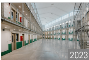
Gevangenis in België (Nieuw Dendermonde)